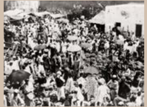
Marché aux fruits de Zanzibar