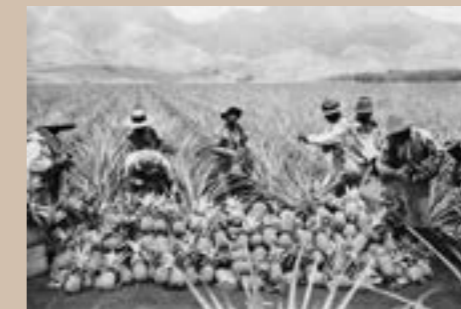
Vol 18 – 633 Un tipi peint – Assiniboine