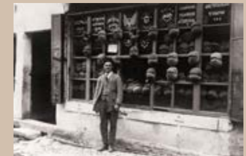
Le boulanger, Istanbul, Turquie