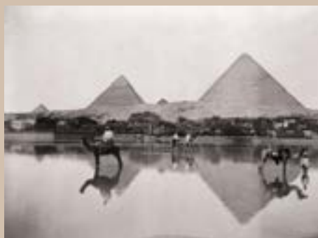
Les pyramides à la saison des pluies, Egypte