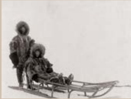
Couple sur un traineau à chiens, Nome, Alaska