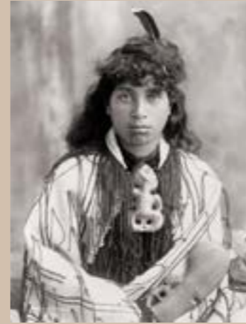
Jeune maori, Rotorua, Nouvelle Zélande