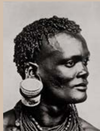
Homme avec un pot de confiture en guise de boucles d'oreilles, Kenya