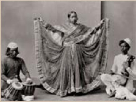
Danseuse de Nautch, Calcutta, Inde