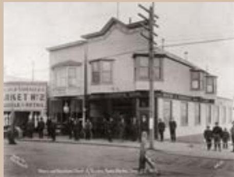
Groupe de mineurs, Nome, Alaska