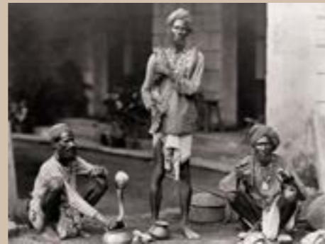
Charmeurs de serpents, Inde