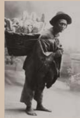
Vol 02 – 053 Luzi – Papago