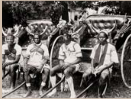
Conducteur de rickshaw, Durban, Afrique du Sud