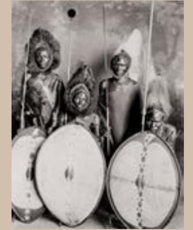
Guerriers Masaï, Kenya