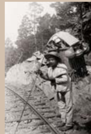
Porteur de poteries, Mexique, vers 1900