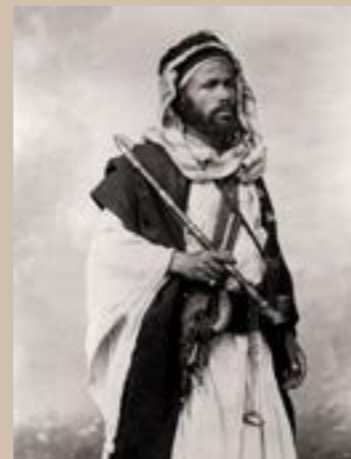
Un Bédouin tenant sa longue pipe, Arabie