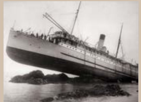
Le SS Princess May, Alaska