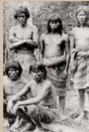
Groupe de chasseurs de têtes dans le bassin de l'Amazone, Brésil