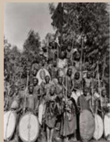
Groupe de Kavirondo, Kenya