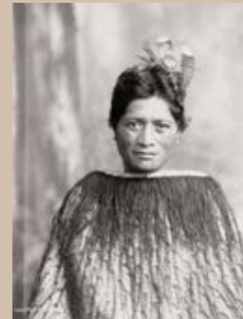
Maori, Nouvelle Zélande