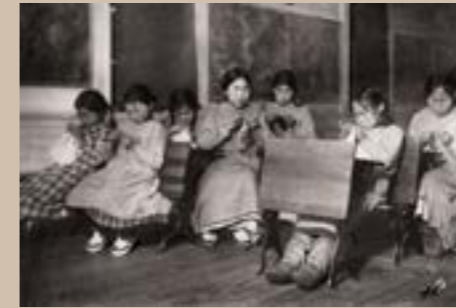
Classe de couture, Point Barrow, Alaska, Etats-unis