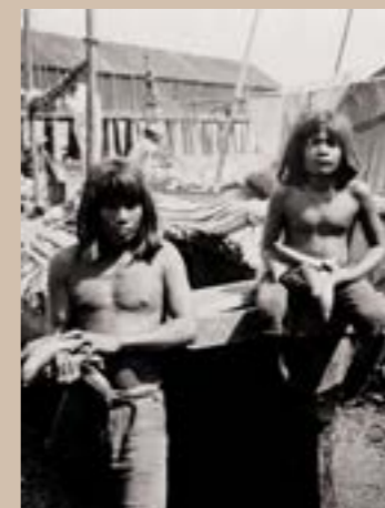
Indiens des San Blas, Panama