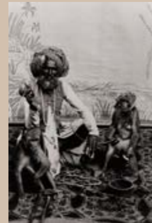
Fakir dresseur de singes, Inde