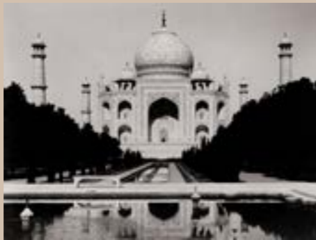
Le Taj Mahal, Inde