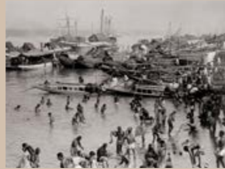
Baignades des hommes entre les bateaux de pêcheurs, Thaïlande