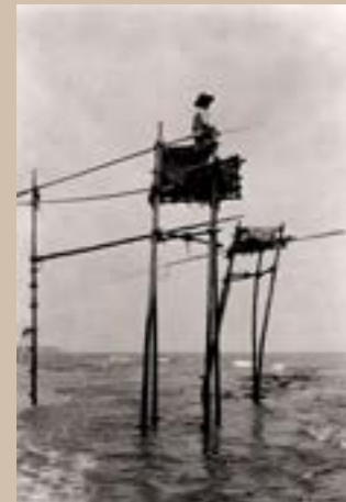
Pêcheur sur sa tour de bambou, Kamakura, Japon