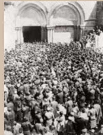
Foule célébrant la Pâques orthodoxe, Jérusalem, palestine