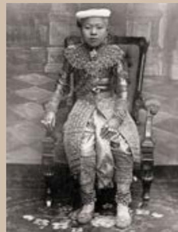
Jeune prince, Thaïlande