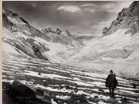
Homme dans la vallée enneigée de l'Aconcagua, Argentine