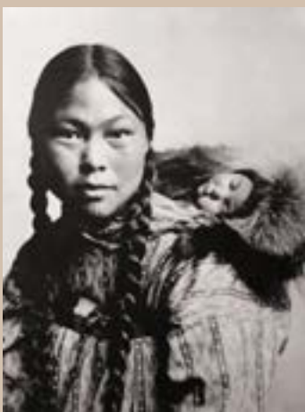
Mère Inuit avec son enfant sur le dos, Alaska, Etats-unis