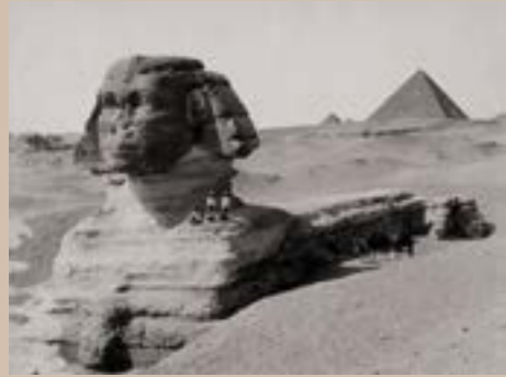
Le Sphinx, Egypte