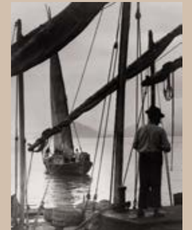
Bateaux de pêcheurs, Rio de Janeiro, Brésil